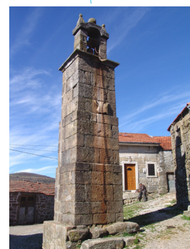
Torre do Boi em Travassos do Rio