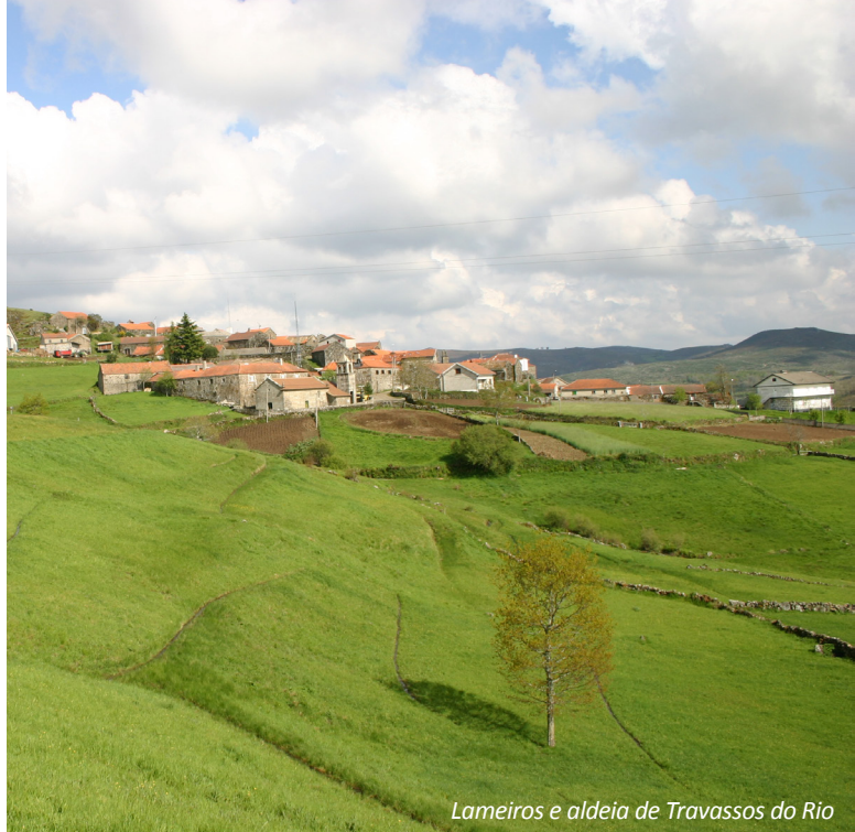
Lameiros e aldeia de Travassos do Rio

Este troço do vale do rio Cávado possui uma das maiores e mais bem conservadas manchas autóctones de carvalho no nosso país, incluindo várias espécies de árvores e arbustos, como o azevinho, zangarinho, lamagueira, salgueiro e vidoeiro. Neste caminho é possível encontrar lameiros ou prados lima, normalmente localizados em redor das pequenas aldeias e com uma grande diversidade de flores silvestres. Nesta área, e associado ao carvalho e lameiros, verifica-se uma elevada diversidade de fauna, sendo este um dos poucos locais, a nível nacional, de ocorrência de algumas espécies raras e ameaçadas. Para além dos mamíferos raros como o corço, o gato bravo, o arminho, a longos e a toupeira de água, existem também vários répteis e anfíbios, com a víbora de Seoane e a salamandra lusitânica. De realçar o omnipresente rio Cávado, um dos mais bonitos e bem conservados rios de montanha do Noroeste de Portugal. A este curso de água ocorrem duas espécies de invertebrados muito raros: o escaravelho-veado e o mexilhão-de-água-doce.