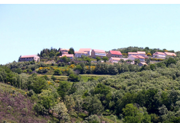
Vista sobre a aldeia de Loivos do Rio