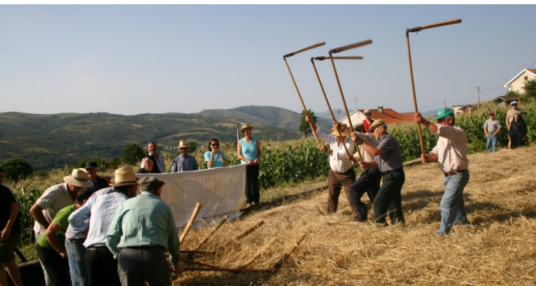
Malhada em Paredes do Rio