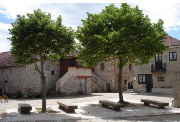
Largo do Outeiro em Tourém