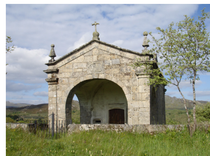
Capela de S. Lourenço