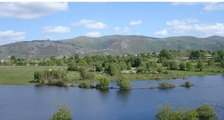
Albufeira de Sallas