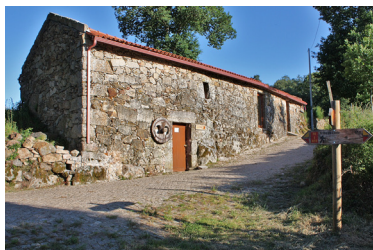
Pólo do Ecomuseu de Barroso