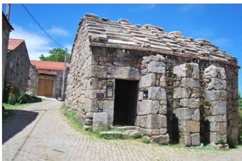
Forno Comunitário de Tourém